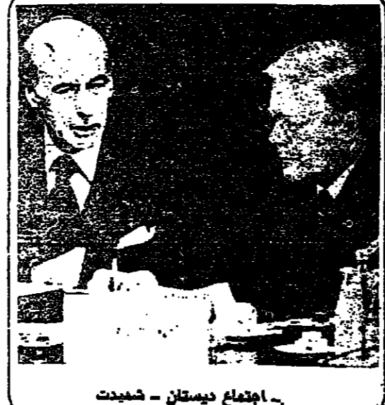
اجتماع ديستان - شميت

مكاسب ضخمة او سهلة ما دامت المتباة الغربية واليابان في الميدان ، ان اهداف الموقد الفرنسي هي اهداف سياسية في الدرجة الاولى . فالبيان الاتي بالفرنسي المشترك يساهم الى حد كبير في السدور الحقيق الذي تسعى اوربا للقيام به . قادة فرنسا والمانيا لا يميلون للكارتر ان للزعما الاثنان والفرنسين نفسي لهم معتقدون بخطة السياسة التي انتهجتها فالمصرت الوحيد الذي يسلمه كارتر هو صوت التخاب الامريكى . انهم لا ينظرون بجدية الى شخصية كارتر كرجل دولة وهم الان لا يعتبرونه محاربا كما يحاول ان يبدو ، وفي هذه النقطه بالذات فانهم على خطأ جسيم . خطا الاوروبيين في البداية لم تكن دوافع كارتر سياسية تعظر تصدير الحبوب الى الاتحاد السوفياتي لم يكن يبدو عملا سياسيا جيدا في وقت كان مؤيد الحزب الديموقراطي في اوربا فالمصرت الوحيد الذي يسلمه كارتر هو صوت التخاب الامريكى . انهم لا ينظرون بجدية الى شخصية كارتر كرجل دولة وهم الان لا يعتبرونه محاربا كما يحاول ان يبدو ، وفي هذه النقطه بالذات فانهم على خطأ جسيم . خطا الاوروبيين في البداية لم تكن دوافع كارتر سياسية تعظر تصدير الحبوب الى الاتحاد السوفياتي لم يكن يبدو عملا سياسيا جيدا في وقت كان مؤيد الحزب الديموقراطي في اوربا